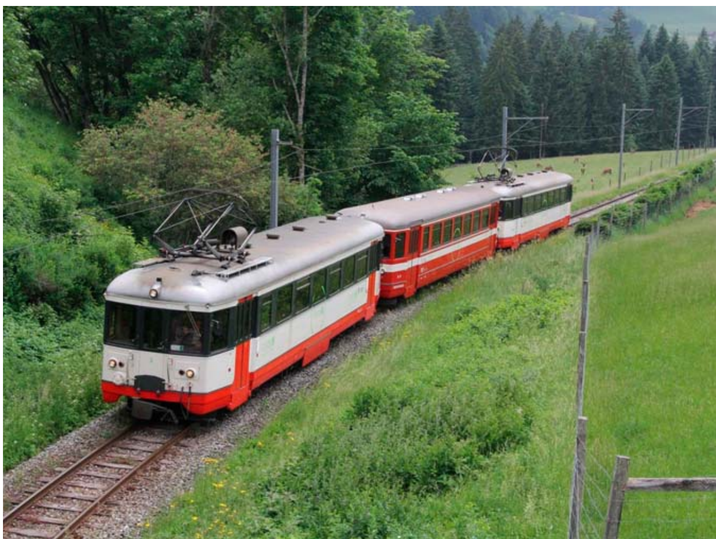
Le train historique des Brenets continuera à circuler en 2024.

Quitte à agrandir le tunnel, estiment ses membres, autant transformer l'étroite voie ac-